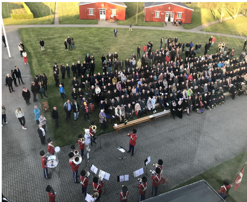
Gæster og aktører ankommer, 4. maj arrangementet 2018

Foreningen Frøslevlejrens Venner marts 2019 nr.102