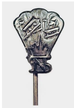
Sølvnål til medlemmer af Sabotagegruppe Nord. Fremstillet af sølvvarefabrikken i Horsens

Der skulle bruges mange mænd – navnlig som vagter osv. Jeg var lidt bange for den aktion. Ude på landet var jeg tryk, men at komme ind på brostenene, hvor jeg ikke var kendt, huede mig ikke. Ja, aktionen var mægtig, men jeg var ikke glad for at være med. Vi tog selvfølgelig ud til "Sømandens" havehus, der lå i den øverste ende af kolonihaven. Da vi