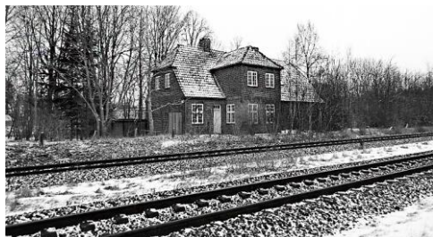
Tvingstrup station hvor "sprængningen" af skinnelageret fandt sted

Det var gået op for mig, at jeg var kommet ind i en kommunistgruppe. Men det gjorde ikke mig noget, for under krigen var der ingen skel blandt modstandsfolk, som jeg kendte. Det var arbejdet, der betød noget! Ved den