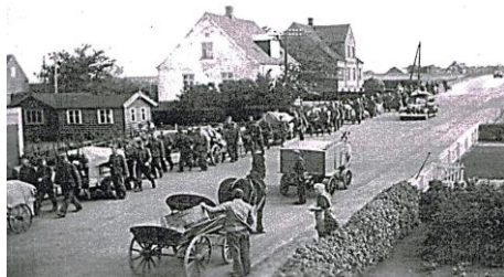
Tvingstrup april 1940. Tyske soldater på vej mod Aarhus.

mellem Tvingstrup og Åes. Jeg så under morgenmalkningen de tyske flyvemaskiner. Som fodermester havde jeg nogle timer fri midt på da- gen. Jeg gik op til nabogården for at snakke om situationen – alt arbejde lå stille den dag. Om eftermiddagen cyklede jeg op til hovedvej 10, hvor tyskerne kom kørende.