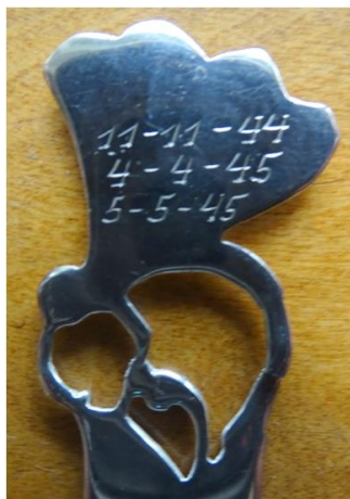
Sølvskæen med de tre datoer