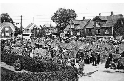
Tyskerne boede i telte nu. Vi skulle gå vagt ved dem og jeg gik mest om nætterne.

Tyskerne ramte bagruden samt Agners hånd, men han slap fra dem – kørte ud til hospitalet, hvor han blev behandlet. Jeg ringede til Boesen på Serridslevgård for at diskutere, hvad der kunne gøres for at dæmpe tyskernes vrede og især deres skyderi. Vi blev enige om, at jeg skulle gå ned til skolen ved forsamlingshuset for at tale med den tyske kommandant. Jeg kom ind i lærer Frederiksens stue og fandt den tyske officer. Jeg gjorde høfligt opmærksom på, at vi var lige så mange som dem og at det nok var klogt at standse skyderiet. Krigen var jo slut. Officeren hørte venligt på mig og snart derefter ophørte skudsalverne.