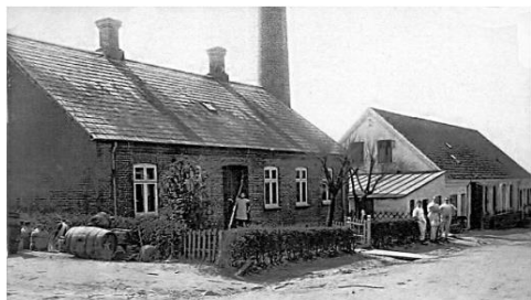
Mejeribestyrerboligen i Tvingstrup

Men de var altså irriteret på det forhold og nu hvor tyskerne havde kaptuleret, tænkte de, nu skal vi gøre noget ved den sag: "Vi ordner den sag," mente de. Jeg har nu aldrig kunnet